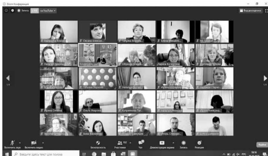
В этом году конкурс и форум проходили онлайн

Утро 21 октября началось с волнения и радости. Названы победители V Всероссийского профессионального конкурса «Арктур» в номинациях, а также абсолютные победители (обладатели первых мест). Абсолютные победители награждены денеж-