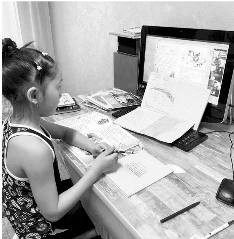
Урок на дистанции

То же и в образовании. Этот период был тяжелым - день шел за пять. Но он толкнул школу к развитию. И я говорю не о конкретной школе, а в целом. В какой-то момент по части знакомства с информационными технологиями современные дети опередили школу. А пандемия подтолкнула нас всех быстрее перейти на «цифру» и, по крайней мере, догнать своих учеников в этом плане (а в чем-то даже перегнать). Пандемия хотела взять нас блиц-кригом, но не тут-то было! Я бы поставил нам всем оценку «4+» (всегда есть куда стремиться). Мобилизовались все - дети, учителя, родители. В итоге пережитый опыт оказался полезным.