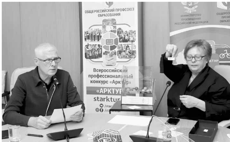
Церемония жеребьевки очередности выступлений конкурсантов

Они все-таки состоялись, финал Всероссийского профессионального конкурса «Арктур» и форум по вопросам дополнительного образования детей. Пятый юбилейный конкурс прошел онлайн. Долгожданный, придуманный Общероссийским Профсоюзом образования, поддержанный Минпросвещения России, подготовленный силами многих людей, при участии экспертов в сфере дополнительного образования и технических специалистов, которые старались создать максимально комфортные условия участникам и жюри. Мы были вместе - в Москве, центральном аппарате профсоюза, в Волгограде, который готовился принять «Арктур» и форум в год 75-летия Великой Победы, по всей стране, где конкурсанты и члены жюри, волнуясь за качество связи и качество выступлений, подключались к платформе Zoom. Как это было? Все события трех дней были записаны, и вы можете их увидеть: forum.starktur.ru . Задача автора этих строк - помочь с навигацией.