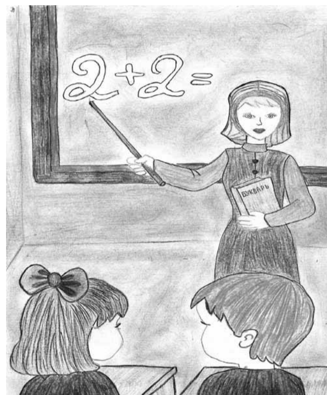
Дарья ИГНАТЬЕВА, ученица 1-го класса средней школы №14 г. Балахна