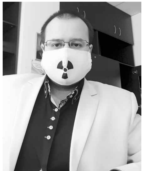
Модный лук директора

Но мало просто оснастить людей техникой, надо еще обучить ею пользоваться. Да, мы тут далеко не все информатики, хотя в нашей школе это мейнстрим. Большинство педагогов, в том числе в возрасте, активно используют IT-технологии. Одна учительница, которую я очень уважаю, к сожалению, уволилась еще до пандемии в возрасте примерно 70 лет. Она с удовольствием осваивала компьютер и недавно призналась, что ей жаль, что в пандемию она не поработала, потому что ей было бы интересно проверить свои силы.